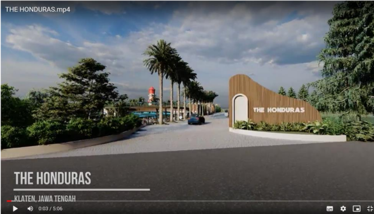
THE HONDURAS, Ponggok, Klaten, Jateng INVESTOR - PROGRESS