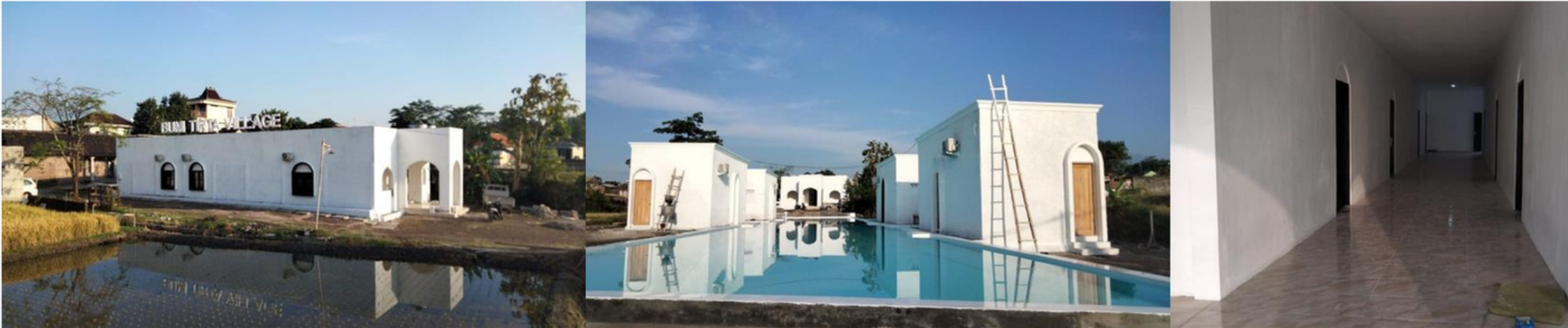
BUMI TIRTA VILLAGE, Ponggok, Klaten, Jateng CSR BNI 46 - PROGRESS