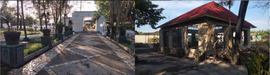
PONGGOK PARADESO, Ponggok, Klaten, Jateng CSR BNI 46 - PROGRESS REVITALISASI