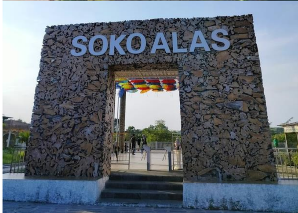
SOKO ALAS, Ponggok, Klaten, Jateng INVESTOR - OPEN